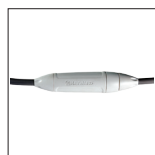
Système de câble tournant