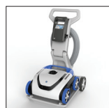
Nouveau chariot ergonomique